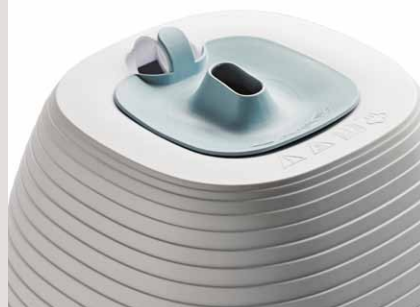
Compartiment huiles essentielles